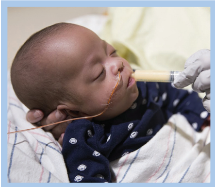
Isang sanggol na tumatanggap ng colostrum sa pamamagitan ng hiringgilya